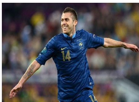
Jérémy Ménez international français