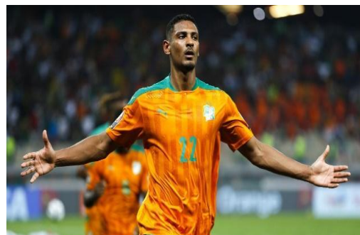
Sébastien Haller. international ivoirien